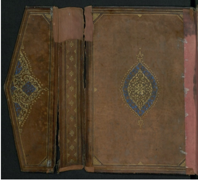
Fotoğraf 5: A.3169 Envanter Numaralı Cildin İç Kapağı ve Miklebi (TSMK, III. Ahmed Kitaplığı)

Kapak içinde kahverengi deri kullanılmış, her iki kapağın deseni aynı düzenlenmiştir. Kapaklar iki sıra altın cetvel ile çerçevelemiş; kenar ortalarına, köşelerine ve sertab bölümüne aletle yapılmış düğüm motifleri yerleştirilmiştir.