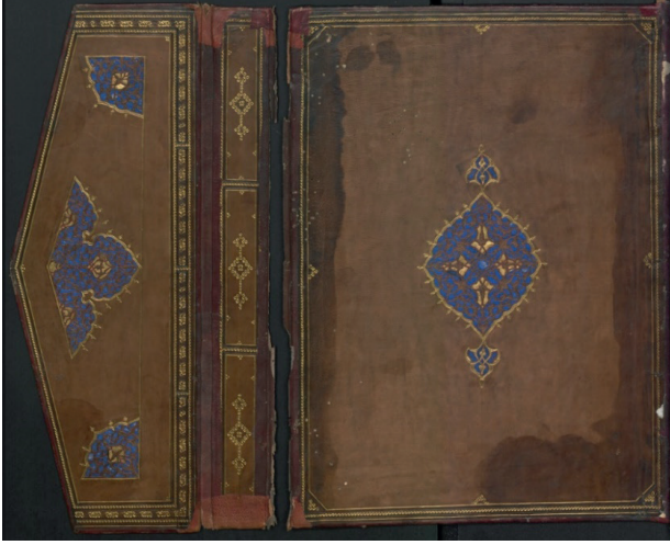
Fotoğraf 1: A.242 Envanter Numaralı Cildin İç Kapağı ve Miklebi (TSMK, III. Ahmed Kitaplığı)

Araştırmada konu olan ilk eser A.242 envanter numarada kayıtlı “Camiu’s-Sahih”, Ebu Abdullah Muhammed b. İsmail el-Cu’fi el-Buhari tarafından yazılmıştır. 1338 yılında Kutlu Hacı b. Abdullah et-Türki tarafından istinsah edilmiştir. Vişneçürüğü rengindeki deri cildin mücellidi belli değildir. Arapça yazılan eser 27,5x37 cm.’dir.