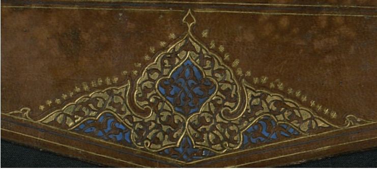
Fotoğraf 7: A.3169 Envanter Numaralı Cildin Miklebi (TSMK, III. Ahmed Kitaplığı)

üzerinde penç ve gonca gül motifi görülür. Salbek yazma tarzında yapılmış tepelik motifidir, şemseye bitişiktir. Şemsenin etrafı tahrirlenmiş, şemse ve salbek etrafına tığ çekilmiştir.