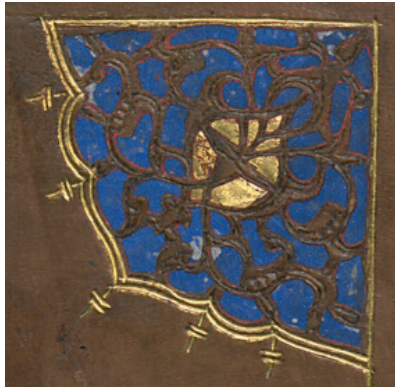
Fotoğraf 4: A.242 Envanter Numaralı Cildin Miklep Köşebendi (TSMK, III. Ahmed Kitaplığı)

Miklep zencirek ve bordür ile kuşatılmıştır. Bordürler zencireklerle kartuşlara bölünmüş ve içerisi düğüm motifi ile süslenmiştir. Miklep şemsesi ve miklep köşebentleri lacivert zemin üzerine katı' tekniği ile bezenmiştir. Miklep köşeleri çeyrek daire şeklinde düzenlenerek köşebent bezemesine dönüştürülmüş rumilerle bezenmiştir. Miklep şemsesi dendanlı \frac{1}{2} haçvari formda tasarlanmış ve tezyinatı rumî motifleriyle oluşturulmuştur. Üç eşit dikdörtgen panoya ayrılan sertab yüzeyi, geçmeler yaparak düğüm oluşturan motiflerin meydana getirdiği baklava dilimi şeklindedir.