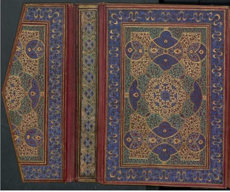
Fotoğraf 12: A.21 Envanter Numaralı Cildin İç Kapağı ve Miklebi (TSMK, III. Ahmed Kitaplığı)

İncelenen dördüncü eser ise A.21 envanter numarada kayıtlı “Tefsir-i Mevahib-i Aliye” 1519 yılında İbn Rafieddin Fazlullah tarafından istinsah edilmiştir. Koyu kahverengi deri cildin mücellidi belli değildir. Farsça yazılan eser 23,5x33 cm.’dir.