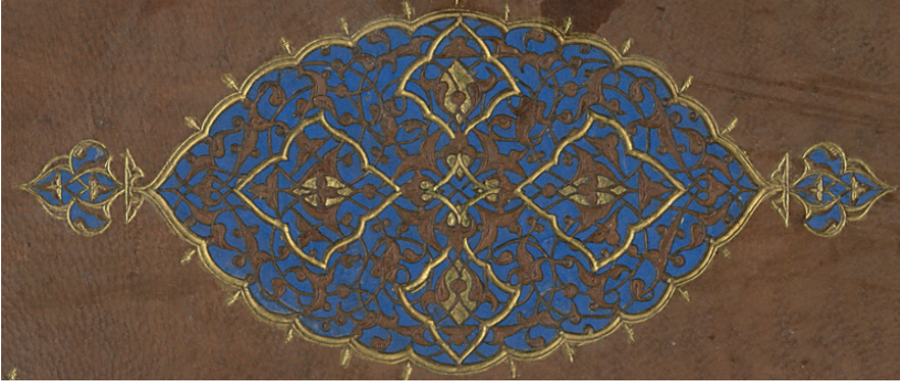
Fotoğraf 10: A.1357 Envanter Numaralı Cildin Şemsesi (TSMK, III. Ahmed Kitaplığı)

işlenmiş tepelik ve rumi motifleri ile bezenmiştir. Ayrıca dendanlar ile yüzeyde sapları merkezde birbirine bağlanan ve üzeri altınla boyanmış dikey ekseninde büyük, yatay ekseninde ise küçük iki adet tepelik şeklinde paftalara ayrılmıştır.