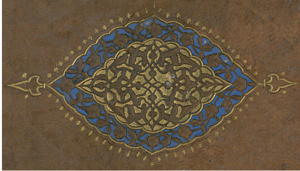
Fotoğraf 6: A.3169 Envanter Numaralı Cildin Şemsesi (TSMK, III. Ahmed Kitaplığı)

Kapak içinde kahverengi deri kullanılmış, her iki kapağın deseni aynı düzenlenmiştir. Kapaklar iki sıra altın cetvel ile çerçevelemiş; kenar ortalarına, köşelerine ve sertab bölümüne aletle yapılmış düğüm motifleri yerleştirilmiştir.