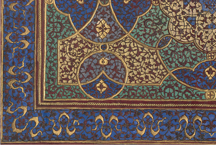
Fotoğraf 13: A.21 Envanter Numaralı Cildin İç Kapak Detayı (TSMK, III. Ahmed Kitaplığı)

Merkezde madalyon ve madalyondan çıkan paftalara ayrılmış olan yüzeyde rumi, bulut, hatayi, penç, gonca ve yaprak motifleri yer alır. Yüzey zemini lacivert, mavi, yeşil, altın ile renklendirilmiştir; motiflerde ise renk kullanılmamıştır. Sertab kare ve dikdörtgen formda paftalara ayrılmış, bitkisel motiflerle süslenmiştir. Zemininde altın, yeşil ve mavi renk kullanılmıştır. Motifler deri rengindedir.