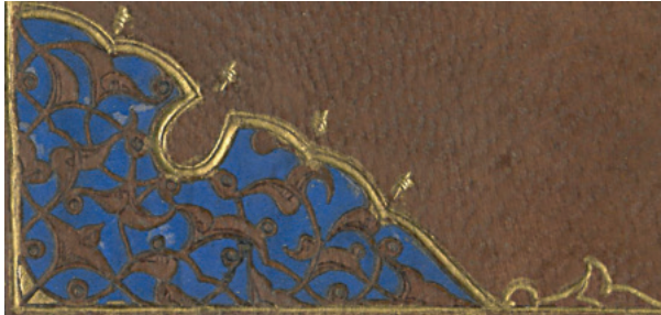
Fotoğraf 9: A.1357 Envanter Numaralı Cildin Köşebendi (TSMK, III. Ahmed Kitaplığı)

Köşebentler içeriye yuvarlak kıvrımlıdır. Baba Nakkaş üslubunda (Aşıcı 2015: 310) klasik tarza yakın, şemse ve köşebentlerde içeriye doğru yuvarlak yapan kıvrımların yer alması Fatih Sultan Mehmed döneminin özelliklerindedir (Boydak 2016: 229). Uçlarında yarım salbek uygulaması vardır. Köşebente, lacivert renkli zemin üzerine katı' sanatı uygulanmış ve dalların taşıdığı tepelik ve rumi motifleri mevcuttur.