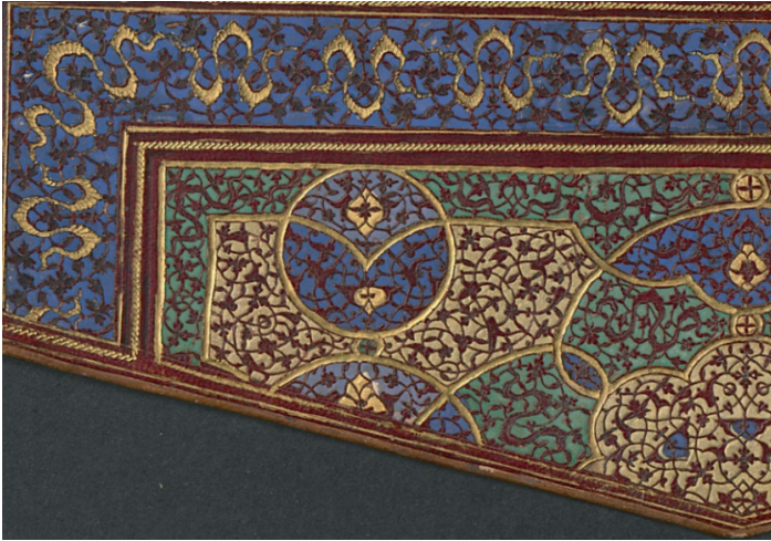
Fotoğraf 14: A.21 Envanter Numaralı Cildin Miklep Detayı (TSMK, III. Ahmed Kitaplığı)

Merkezde madalyon ve madalyondan çıkan paftalara ayrılmış olan yüzeyde rumi, bulut, hatayi, penç, gonca ve yaprak motifleri yer alır. Yüzey zemini lacivert, mavi, yeşil, altın ile renklendirilmiştir; motiflerde ise renk kullanılmamıştır. Sertab kare ve dikdörtgen formda paftalara ayrılmış, bitkisel motiflerle süslenmiştir. Zemininde altın, yeşil ve mavi renk kullanılmıştır. Motifler deri rengindedir.