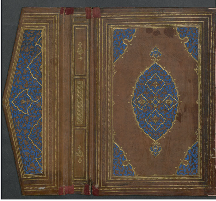
Fotoğraf 8: A.1357 Envanter Numaralı Cildin İç Kapağı ve Miklebi (TSMK, III. Ahmed Kitaplığı)

Köşebentler içeriye yuvarlak kıvrımlıdır. Baba Nakkaş üslubunda (Aşıcı 2015: 310) klasik tarza yakın, şemse ve köşebentlerde içeriye doğru yuvarlak yapan kıvrımların yer alması Fatih Sultan Mehmed döneminin özelliklerindedir (Boydak 2016: 229). Uçlarında yarım salbek uygulaması vardır. Köşebente, lacivert renkli zemin üzerine katı' sanatı uygulanmış ve dalların taşıdığı tepelik ve rumi motifleri mevcuttur.