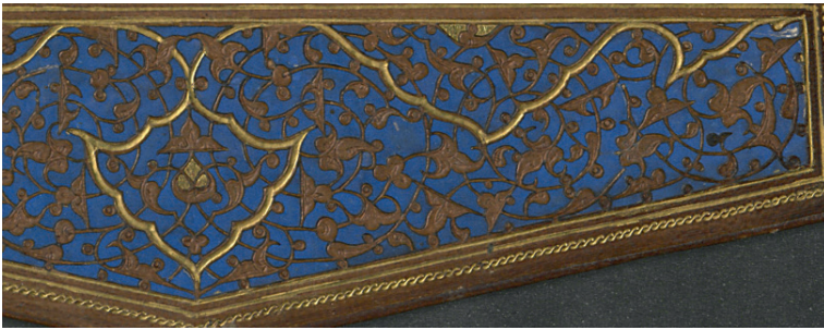
Fotoğraf 11: A.1357 Envanter Numaralı Cildin Miklep Detayı (TSMK, III. Ahmed Kitaplığı)

Miklep süsleme kompozisyonu da katı’ tekniğindedir. Zemin lacivert, motifler deri renginde bırakılmıştır. Tam zeminli miklep yüzeyi kıvrım dallar üzerinde rumi ve tepelik motifleriyle süslenmiştir. Altın ile yatay ve dikey ekseninde dendanlar ile tepelik şeklinde paftalar oluşturularak şemse görüntüsü verilmiştir.