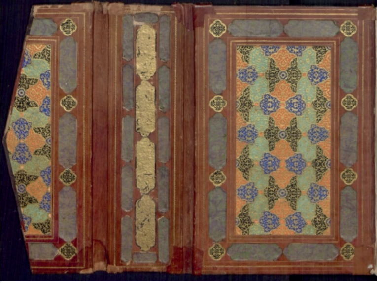
Fotoğraf 15: A.1585 Envanter Numaralı Cildin İç Kapak ve Miklebi (TSMK, III. Ahmed Kitaplığı)

Ele aldığımız son eser ise A.1585 envanter numarada kayıtlı “Külliyat-ı Cami” dir. Vişneçürüğü deri cildin mücellidi ve yazarı belli değildir. Farsça yazılan eser 26,5x38 cm.’dir.