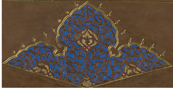
Fotoğraf 3: A.242 Envanter Numaralı Cildin Miklebi (TSMK, III. Ahmed Kitaplığı)

Şemse; dilimli, oval \frac{1}{4} birim simetrik olarak düzenlenmiştir. Şemse lacivert zemin üzerine katı' tekniği ile yapılmış kompozisyonla tezyin edilmiştir. Kompozisyon merkezden uçlara doğru sekiz köşeli yıldızdan çıkan, kartuş oluşturacak şekilde tepelik motiflerinin zemini altınlanmış ve motiflerin etrafı rumilerle çerçevelenmiştir. Şemsenin ucuna yerleştirilen salbekler, şemseye orantılı büyüklüktedir. Rumi motifi ile süslenen salbeklerin etrafı tahrirli, tığ motifleriyle hareketlendirilmiştir.