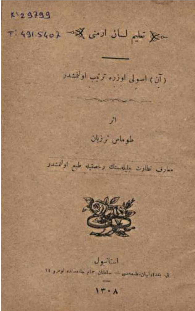
Tomas Terziyan'ın Talim-i Lisan-ı Ermeni adlı eserinin kapağı (Terziyan 1891)

olarak da bilinen Terziyan'ın Katolik bir ailede Rumca konuşan bir babadan ve İtalyan bir anneden doğduğu kaydedilmiştir. Terziyan mahallelerindeki Mıkhitar okulunu bitirdikten sonra Venedik'teki Murad Rafaelyan okuluna gönderilmiş ve 1858 yılında bu okuldan mezun olmuştur. Terziyan bu okulda birçok yabancı dil öğrenmiştir. Bu diller arasında İtalyanca, Grekçe, Fransızca, Türkçe, Klasik Grekçe, Latince ve İngilizcenin yer aldığı kaydedilmiştir. Terziyan ülkeye döndükten sonra kendisini öğretim işlerine adanmıştır. Bir süre Nersisyan ve Nupar-Shahnazaryan okullarında eğitim veren Terziyan daha sonra Hasköy'de bu görevine devam etmiştir (Havcikyan vd. 2005: 380).