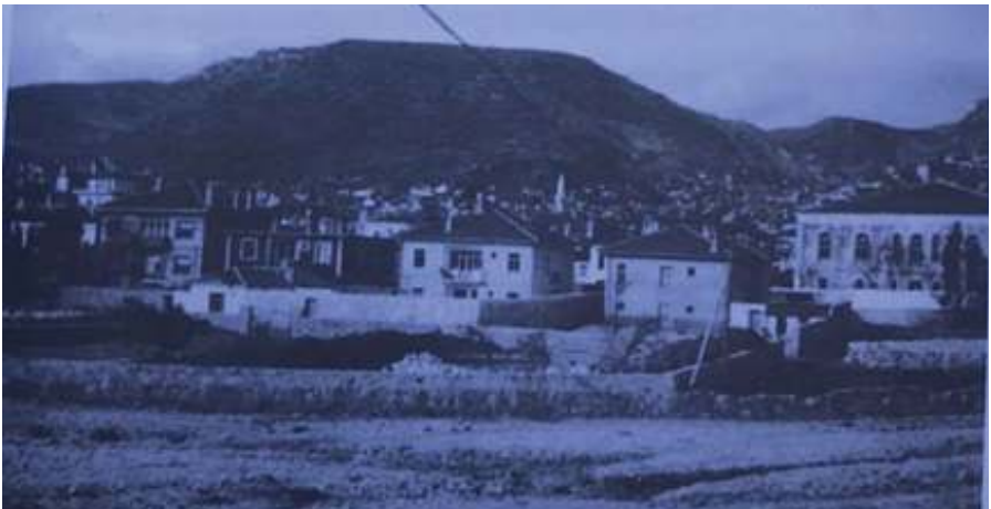
Fotoğraf: Perşembe Pazarı olarak düzenlenen Karamuğla Deresi yatağı (1956)

Pazarlar tarihin her döneminde üreten ile tüketeni bir araya getiren, alış verişin sadece ürün ile sınırlı kalmadığı, kültürel etkileşimin de ağırlıklı olarak görüldüğü noktalardır. Nitekim pazarlar başta gıda malzemeleri olmak üzere çeşitli ihtiyaçların karşılanması amacıyla hizmet etmenin yanında bir yandan insanların sosyal ilişkiler kurmasını sağlamış, diğer yandan da merkezi yerlerin belirginleşmesine yol açmışlardır (Tuncel 2009:36). Dolayısıyla ekonomik olduğu kadar sosyal ve kültürel bir takım özellikleri de taşımaktadır. Pazarları satılan ürünlere, kuruldukları yerlere ya da kurulma zamanlarına göre gruplandırıp adlandırmak mümkündür. Bu noktada Muğla'da kurulan pazar geçmişten bugüne kurulma zamanına göre "Perşembe Pazarı" biçiminde adlandırılmıştır. Bu durum, zaman-mekân ilişkisi noktasında önem arz etmektedir (Tuncel 2009:40-42).