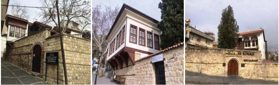
Fotoğraf 1: Deligönüllüler Konağı, Maraş Kültür Evi ve Etnografya Müzesi, Kocabaş Konağı

camii, hamam, medrese, çeşme ve tekkelerle birçok tarihi ve kültürel eser bulunmaktadır (Gökhan 2001; Eyicil 2001). Kurtuluş savaşında Sütçü İmam'ın ilk kurşunuyla birlikte direniş hareketini başlatıp 12 Şubat 1920'de kendi şehirlerini kurtaran önder kentlerden biri olmuştur. Kente 5 Nisan 1925'de kırmızı şeritli istiklal madalyası, 7 Şubat 1973'te de kahramanlık unvanı verilmiştir. 1980'den sonra tüm Türkiye'de uygulanan sanayi teşviklerinin Kahramanmaraş'ın da gelişip büyümesinde büyük etkisi olmuştur. Şehrin tarım ve sanayi potansiyelinin yüksek olması ekonomik anlamda bölgenin bir cazibe merkezi olmasına katkıda bulunmaktadır. Özellikle kırmızıbiber ve pamuk üretimi önem taşımaktadır. Tekstil sektörü ülke ve dünya ölçeğinde çok gelişmiştir. Coğrafi ürünler listesinde yer alan Dondurma başkenti olarak anılmaktadır. Kentte geçmişten günümüze nüfusun gittikçe arttığı görülmektedir. Kahramanmaraş il nüfusu 2019 yılına göre 1.154.102'dir. Bu nüfus %50,83'ü erkek, %49,17'si kadındır. Günümüzde Büyükşehir belediyesi olduğu için kent merkezini oluşturan Onikişubat ilçesi 2019'da 431.848 nüfusa sahip, (216.131'i erkek, 215.717 kadın) Dulkadiroğlu ilçesi ise 222.673 nüfusa sahiptir (114.229'i erkek, 108.444 kadın) (TÜİK 2020).