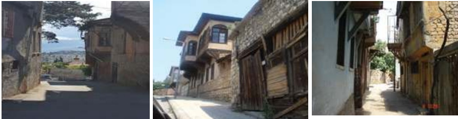
Fotoğraf 5: Dulkadiroğlu İlçesinde Dar Sokaklar Arasında Kalmış Olan Tarihi Konutlar https://mapio.net/pic/p-15205393/