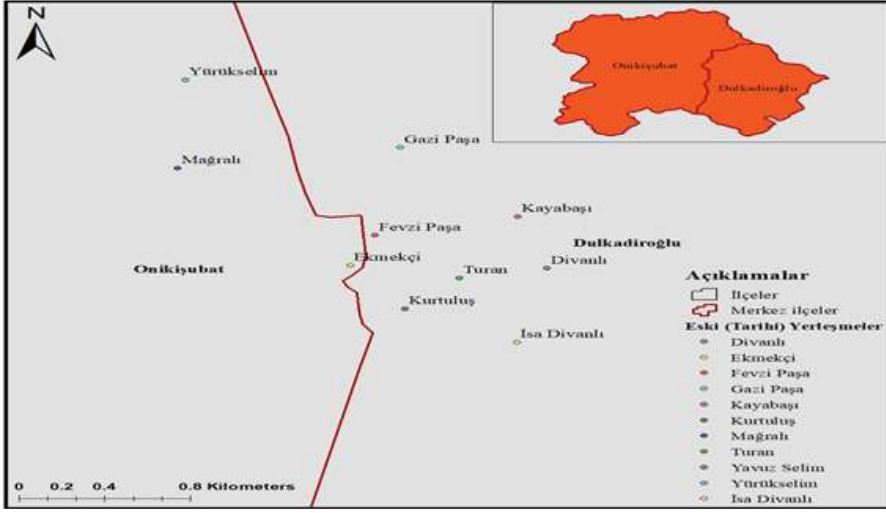
Şekil 2: Onikişubat ve Dulkadiroğlu İlçelerinin Tarihi Konutların Yer Aldığı Mahalleleri

Müzeler Genel Müdürlüğü tarafından 1985’de tescillenmiş olan Dedeoğlu Konağı Kurtuluş Mahallesi’nde yer almaktadır. 2011 yılında Kahramanmaraş Belediyesi tarafından restore edilmiştir (Foto:3). Kâtip Han ise Kahramanmaraş merkezde, Ulu Caminin güneyinde yer almaktadır. İki kapısı vardır. Bu kapılardan biri merkez hanların da bulunduğu çarşılarına açılmaktadır. Bir diğer kapıdan üç yanı ahşap revaklı kare avluya geçilmektedir. Avlunun çevresinde iki katlı han odaları, çeşme ve tuvaletler yer almaktadır. Konağın geçirdiği bir yangından sonra ikinci katı ahşap olarak tekrar inşa edilmiştir. Hanın bir diğer adı Cumhuriyet Han’dır. Günümüzde kamulaştırılan konak restore edilerek Dondurma Müzesi olarak kullanılmaktadır. Zemin ve 2 katlı oluşan konutta her kat ayrı bir sunum alanı olarak hazırlanmış olan dondurmanın çeşitli evrelerinin anlatıldığı bölümler bulunmaktadır (Foto:4).