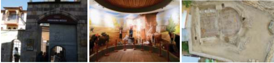
Fotoğraf 4: Katiphan ve Üdürgücü Konağı 2000 Yıllık Anıt Mezar Detayı

Uluganlıgil ve Altunkasa (2020)'nin şehrin mekânsal kimliğinin belirlendiği çalışmalarında Kocabaş Konağı (%19,5), Deli Gönüllüler Konağı (%17, 05) kentin mekânsal bütünlüğü bağlamında bireyler tarafından yüksek düzeyde algılanan imge elemanları, Zabun Konağı (%16,7) ve Dedeoğlu Konağı (%13,55) orta düzeyde temsil eden imge elemanları, Arslanbey Konağı (%7,4) ise düşük düzeyde imge elemanları olan kent kimliğini oluşturan önemli öğeler olarak tespit edilmiştir.