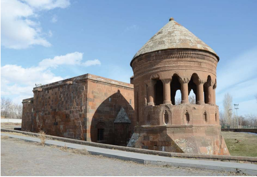
Resim 11. Bayındır Kümbeti ve Günümüzde Cami Olarak Kullanılan Yapı, Zülfiye Koçak, 2021.