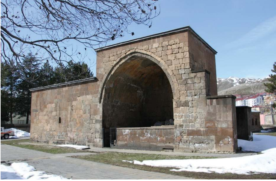
Resim 1. Emir Şemsüddin Zâviyesi, Zülfiye Koçak, 2021.