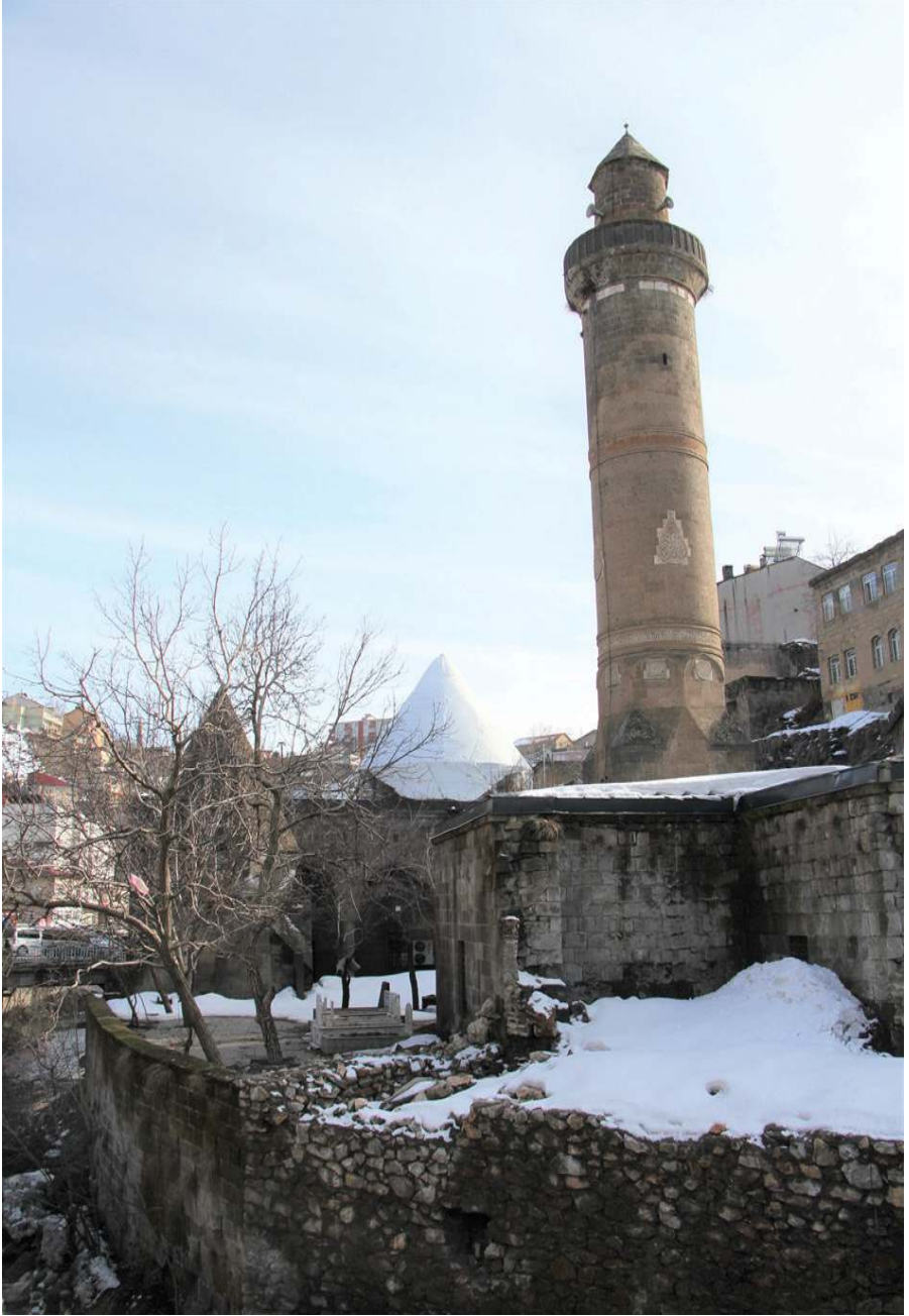
Resim 6. Şerefiye Külliyesi, Zülfıye Koçak, 2021.