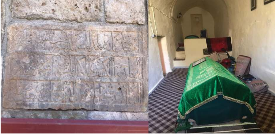
Resim 3. Seyyid İbrahim Camisinin Kitabesi ve Cami İçindeki Seyyid İbrahim Mezar Sandukası, Zülfıye Koçak, 2021.