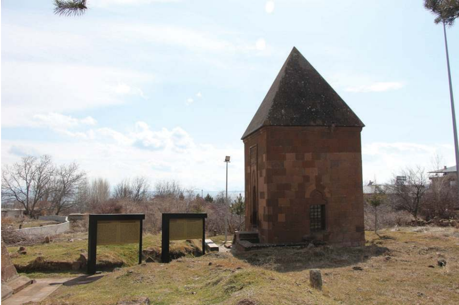
Resim 12. Şeyh Necmeddin Hevayî Türbesi, Zülfiye Koçak, 2021.