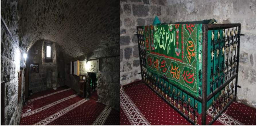
Resim 4. Şeyhü'l-Garib Zâviyesi'nin İç Mekânı ve Şeyhü'l-Garib Mezar Sandukası, Zülfıye Koçak, 2021.