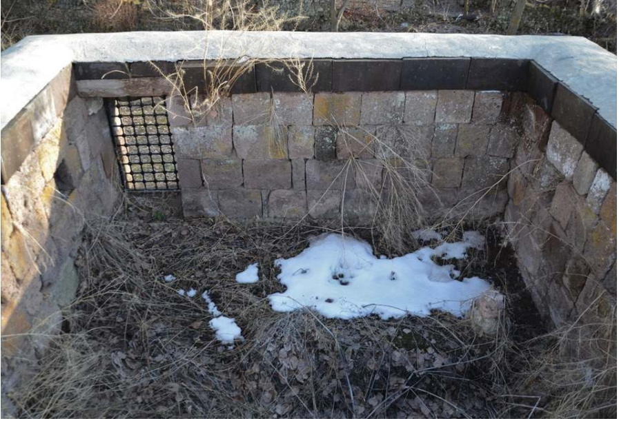
Resim 9. Şeyh Mehmed Sencerhiz'in Mezarı , Zülfıye Koçak, 2021.