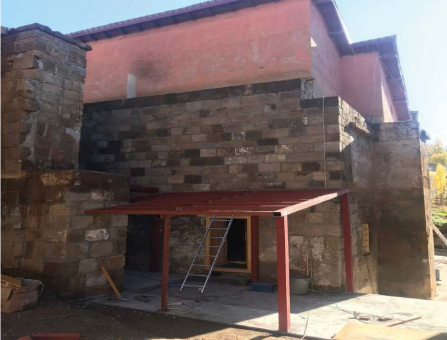
Resim 2. Seyyid İbrahim Camisi Olarak Anılan Cami, Zülfiye Koçak, 2021.