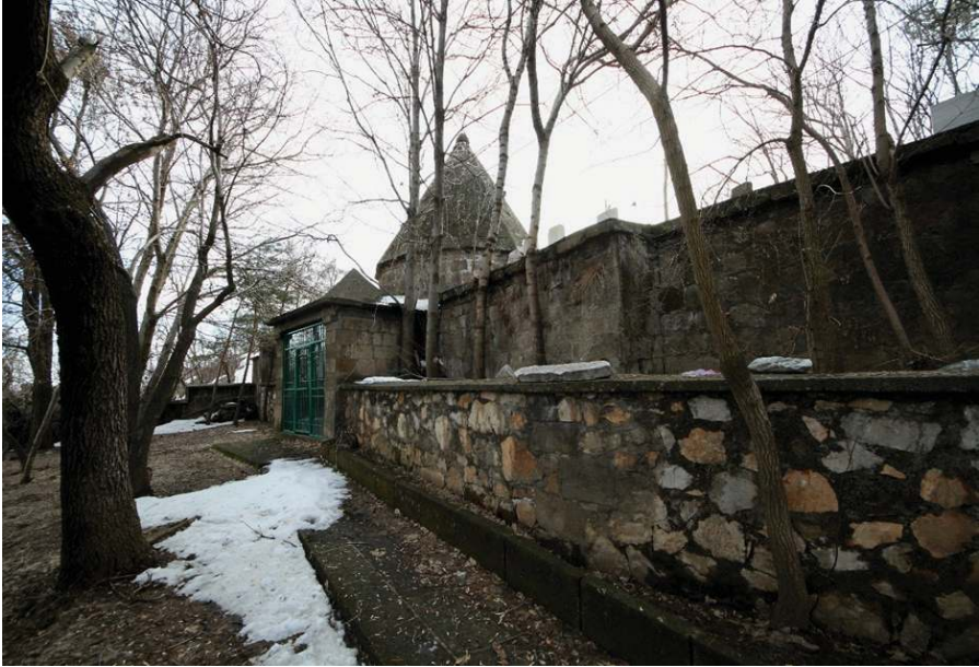
Resim 8. Şeyh Ebu Tahir-i Bidlîsî'nin Türbesinin Bulunduğu Yer , Zülfiye Koçak, 2021.