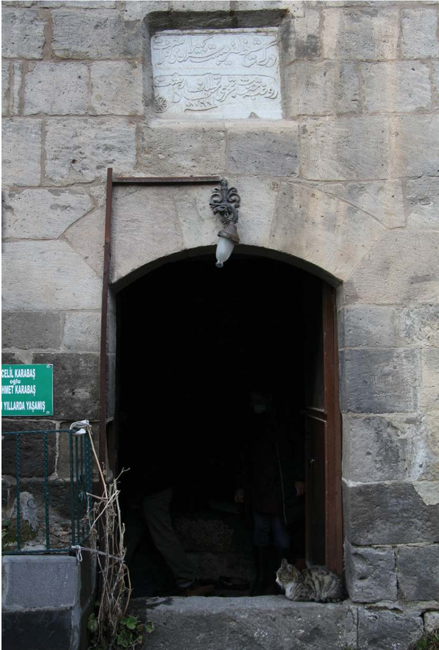
Resim 5. Şeyhü'l-Garib Zâviyesi'nin Giriş Kapısı ve Kapı Üzerindeki Kitabesi, Zülfiye Koçak, 2021.