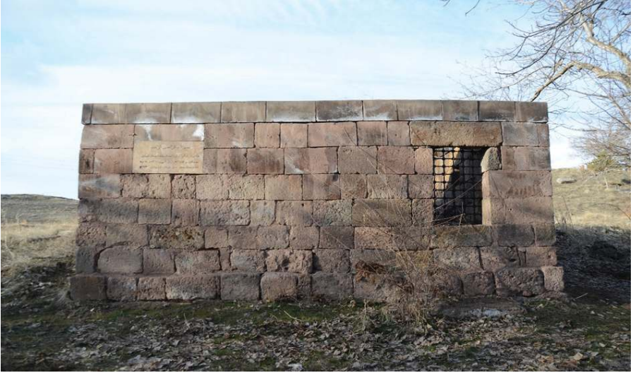
Resim 10. Şeyh Mehmed Sencerhiz'in Mezarı , Zülfıye Koçak, 2021.