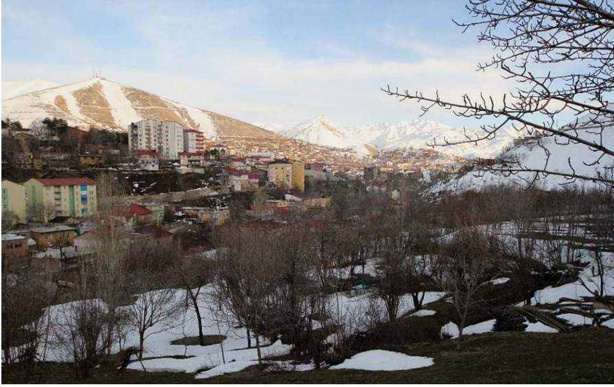
Resim 7. Şeyh İsa Mezarının Bulunduğu Bölge , Zülfiye Koçak, 2021.