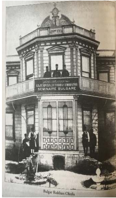
Görsel 7 Şişli Ruhban Mektebi (Kostandov 2018: 108)

Mektebi'nde geceleri kalınan alan yeterli gelmediği için öğrencilerin yarısını alacak ve kış mevsiminde de içinde teneffüs zamanlarını geçirebilecekleri bir mekânın mektep bahçesine inşası tasarlanmıştır. Üç oda bir salondan oluşacak bu yapının inşasına izin verilmesi hakkında Bulgar Eksarhlığı'nın talebi olmuştur. Söz konusu ilavelerin yapılmasında sorun görülmediği anlaşılmaktadır (BOA., DH.MKT., 875/48). Konuya ilişkin bir başka belge inşaatın oldukça kapsamlı tutulduğunu düşündürür. Şişli'de bulunan Bulgar Mektebi'nin 11 öğretmen, 121 öğrenciden ibaret olan mevcudunun mektebe sığamaması nedeniyle mektebin sağ tarafındaki çıkması kaldırılarak salon ve mutfak mahalline de yemek salonu yapılmıştır. Üst kata müdür ve hocalara ait üç oda ile merdivenin bahçeye alınarak taştan inşa edilmesi de gerçekleştirilmiştir. Bununla birlikte mektebin inşası için herhangi bir başvuru yapmadan inşaata başlanmış olması hoş karşılanmamıştır. Yapılan işin basit bir inşa işi olduğu ileri sürülse de sultan iradesi olmadan inşa izninin verilmesinin uygun olmadığı ve inşaatın tatil edilmesi gerektiği buna sebebiyet verenlerin de sorumlu tutulacakları Maarif Nezareti Mekâtib-i İbtidâiye ve Ecnebiye Müfettişliği tarafından bildirilmiştir. İnşaatın ruhsatsız gerçekleşmesi dışında mektep bahçesine gayet büyük bir mahzen yapıldığı da ifade edilmiştir (BOA., MF.MKT., 801/33).