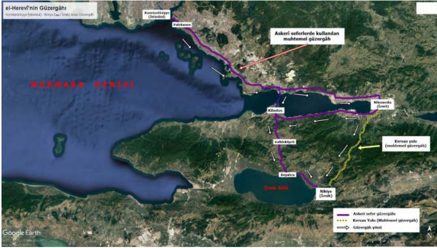
Harita 1: el-Herevî'nin İstanbul – İznik arası güzergâhı 7

- Yalakdere - Kızderbent - Bayındır - Boyalıca güzergâhı ile İznik'e ulaşılmış olmalıdır (Altınkaynak 2023: 103-106). İstanbul - İznik arasındaki mezkûr güzergâh; İskandinavya kökenli bir Viking olan Danimarka Kralı'nın oğlu Svend (Sueno / Sven) Svensson, 1101 yılı Haçlı Seferleri içerisindeki üçüncü birlik olarak gelen Aqutiania (Akitanya) Dükü IX. Guillaume (Giygom) idaresindeki Fransızlar ve Bavyera (Bayern) Dükü IV. Welf idaresindeki Almanlar, Bizans İmparatoru İoannes Komnenos -Denizli, Uluborlu ve 1141 Seferi-, II. Haçlı Seferi esnasında III. Konrad komutasındaki Alman Haçlı birlikleri ve arkasından gelen VII. Louis komutasındaki Fransız Haçlı birlikleri tarafından kullanılmıştır. 6 Bu verileri bir arada düşündüğümüzde el-Herevî'nin de İstanbul - İznik arasında genellikle kullanılan mezkûr güzergâhı takip etmiş olması muhtemeldir. Yalnız şunu da ilave etmeliyiz ki el-Herevî'nin, güzergâhı üzerindeki Nikomedia (İzmit)'dan bahsetmemesi onun deniz yoluyla Kobotos'a ulaşılmış olabileceğini düşündürmektedir. Ancak bunu nihaî olarak söyleyemiyoruz. Askerî birliklerin yollarından ziyade yine ilave etmeliyiz ki İstanbul'dan İzmit'e ve buradan da doğrudan İznik'e ulaşan bir kervan yolu da bulunmaktadır ( İpek Yolu - Kültür Yolu, Anadolu'da Ortaçağ'da Kervan Yolları, Kervansaraylar ve Köprüler 2012).