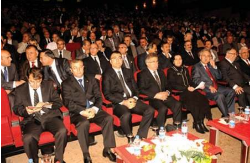
Sempozyum açılış töreninden bir kare