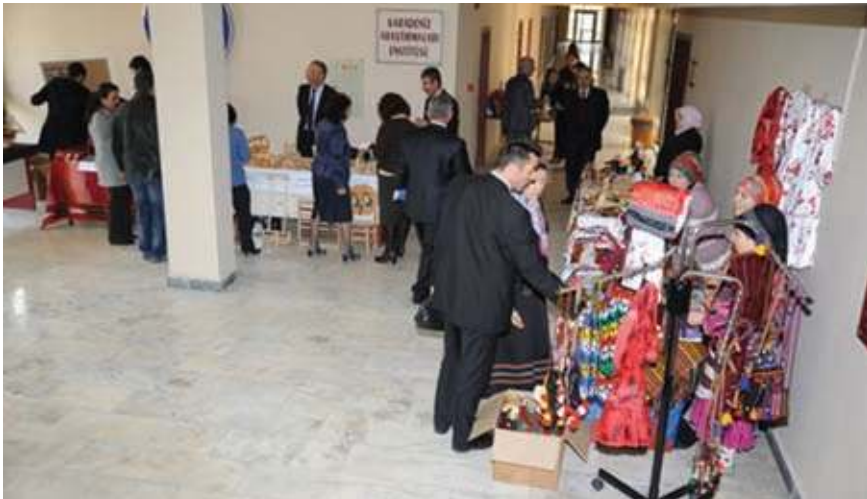
Çalıştayla ilgili olarak açılan ve yöresel el sanatlarının tanıtıldığı sergiden bir kare

Yöresel el sanatlarının tanıtıldığı mini bir serginin de yer aldığı çalıştayda, Merkezimiz ve Karadeniz Teknik Üniversitesi toplumsal ve kültürel meselelerimizin ele alınıp çözümlenmesine öncülük ederek önemli bir başarıya imza attılar.