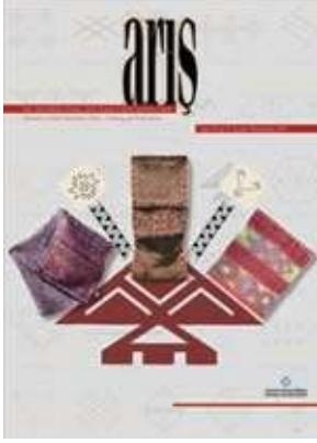
Ar Dergisi, Sayı 6 / Trk Dnyasında Halı ve Dz Dokuma Sempozyumu zel Sayısı-2, Mart 2011.