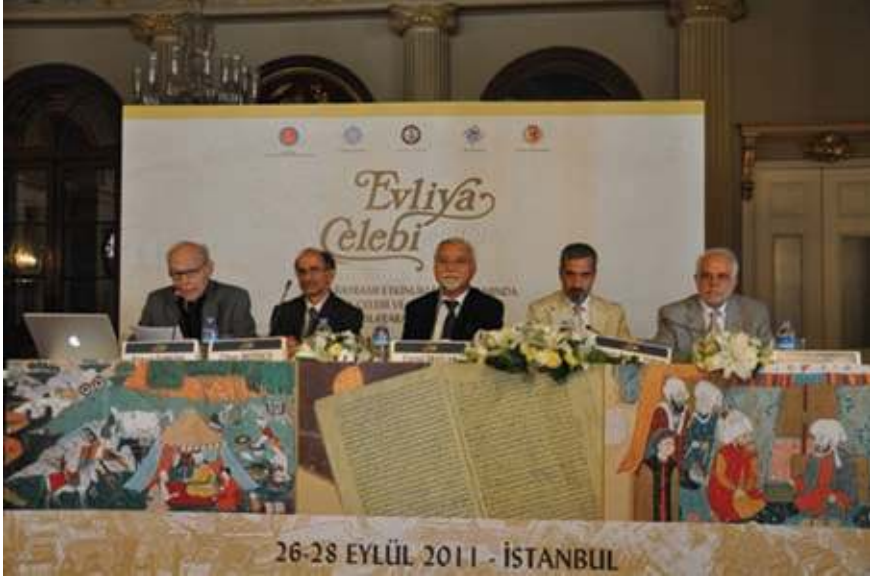
Uluslararası Evliya Çelebi ve Seyahatname'si Toplantısından bir kare