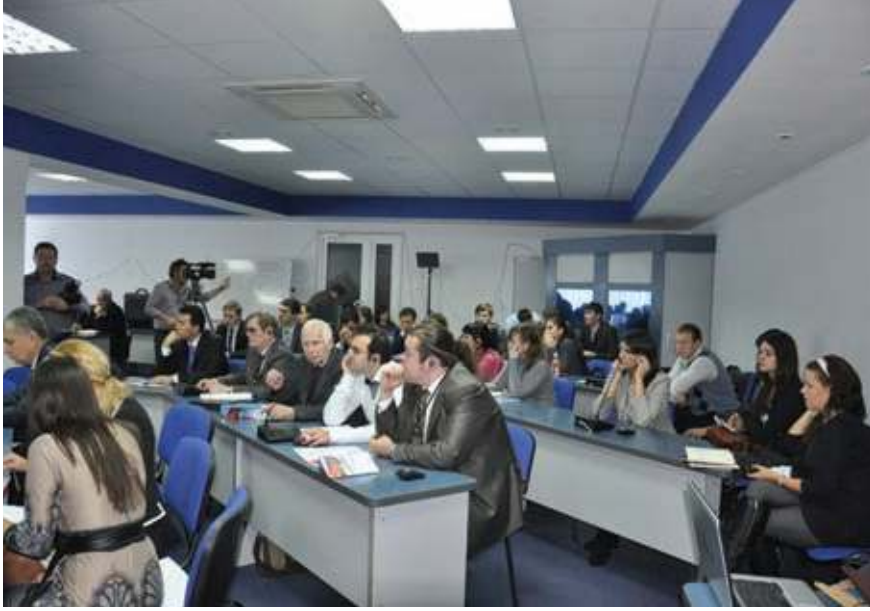
Türk-Rus İlişkileri IV. Çalıştayından bir kare