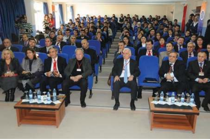
Edebiyatta Yeni Bir Tür: Küçürek Öykü Sempozyumundan bir kare

Öykü yazarı Ferit Edgü de, modern Türk edebiyatının bir temsilcisi olarak Ardahan'da bulunduğunu ve söz konusu sempozyumun öykü dünyası için önemli olduğunu ifade etti. Edgü kısa konuşmasında, ilk kez Ardahan'a geldiğini belirterek, böyle bir sempozyumun gerçekleşmesine öncülük ettiği için Rektör Korkmaz'a teşekkür etti.