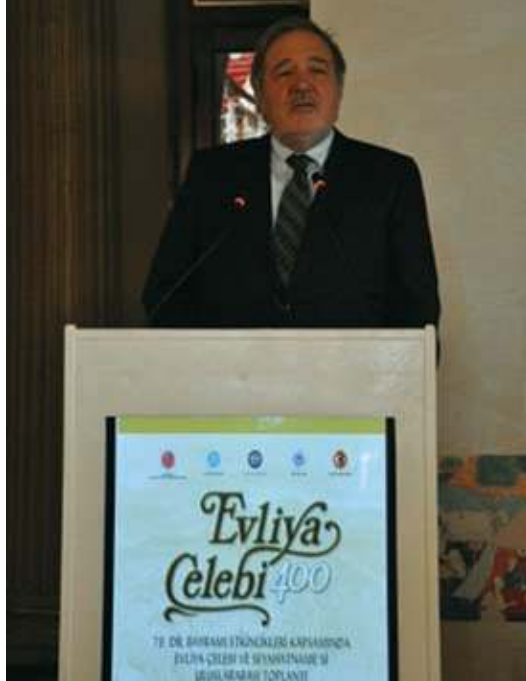
Prof. Dr. İlber Ortaylı, Açılış konuşmalarını sunarken