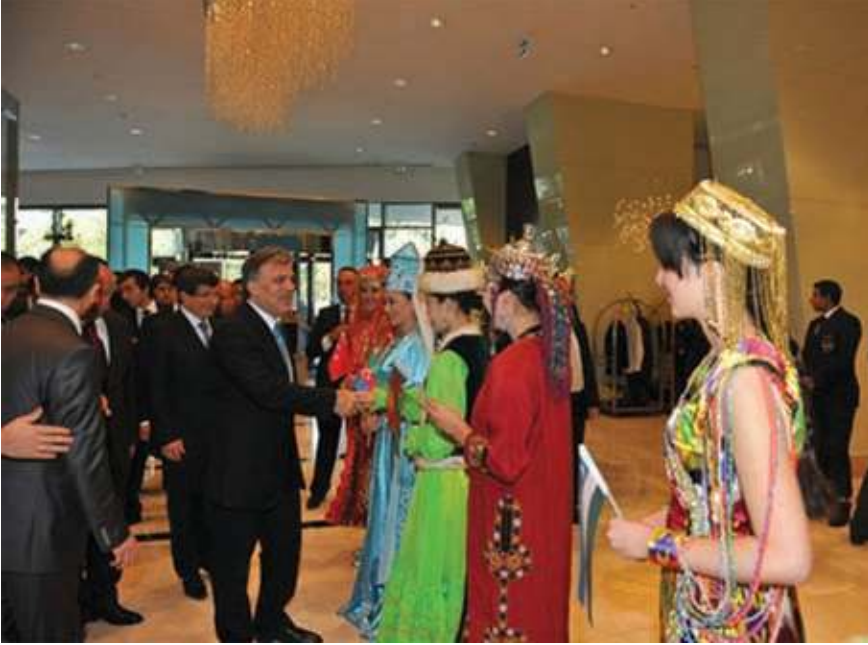
Cumhurbaşkanı Abdullah Gül, kendisini karşılayan Türk cumhuriyetlerinin geleneksel giysilerini giymiş genç kızlarıyla birlikte