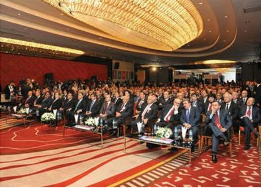
Bağımsızlıklarının 20. Yılında Türk Cumhuriyetleri toplantısı açılış töreninden bir kare