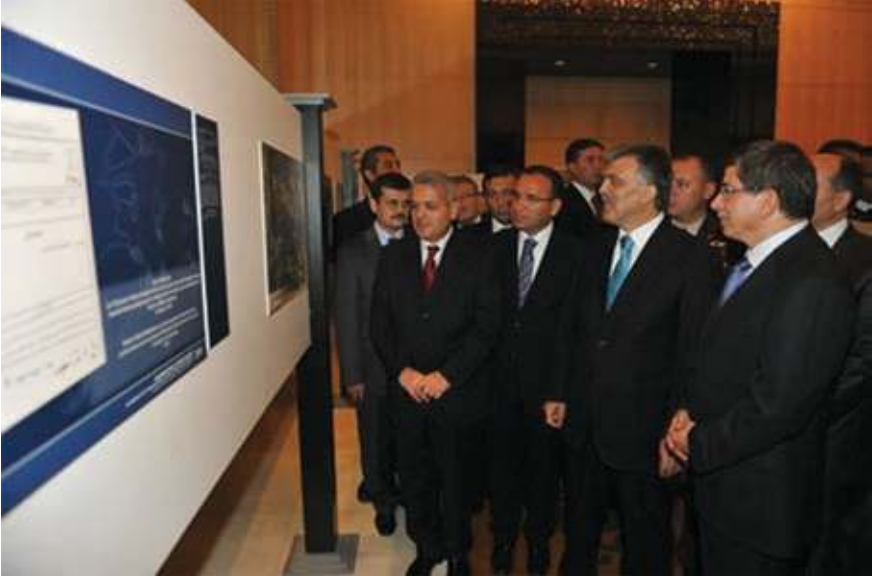
Cumhurbaşkanı Gül ve beraberindekiler, Bağımsızlıklarının 20. Yılında Türk Cumhuriyetleri toplantısında "Belgelerle Osmanlı-Türkistan İlişkileri" sergisini gezerken