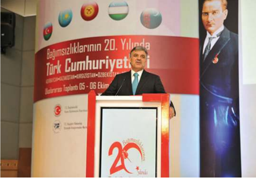
Cumhurbaşkanı Abdullah Gül, Bağımsızlıklarının 20. Yılında Türk Cumhuriyetleri toplantısı açılış töreninde konuşmalarını sunarlar