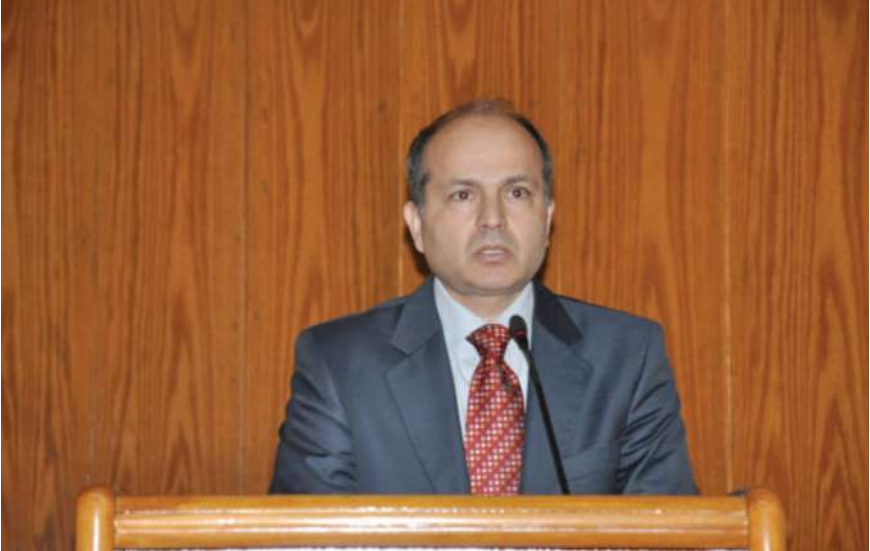
Merkezimiz Başkanı Horata, açış konuşmalarını sunarlarken