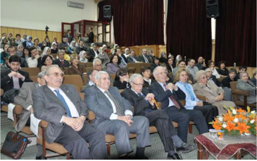
Saygı Paneline katılanlar bir arada