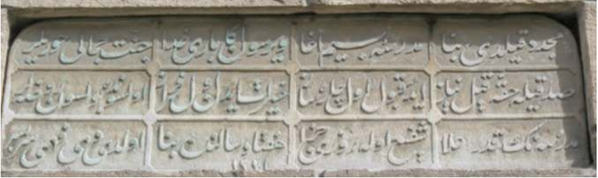
Fotoğraf 19- Orduoğlu Camii'nin kuzey duvarındaki medrese kitabesi

Diğer camilere oranla kaleye uzak sayılabilecek alanda, Herikli Mahallesi'ndeki Hacı Nasuh Ağa Camii , 1856 yılında Herikli aşireti tarafından yaptırılmışken, 1951 yılında yıkılarak bugünkü cami yaptırılmıştır. Cami, kalenin 900 m kadar kuzeyine düşmektedir.