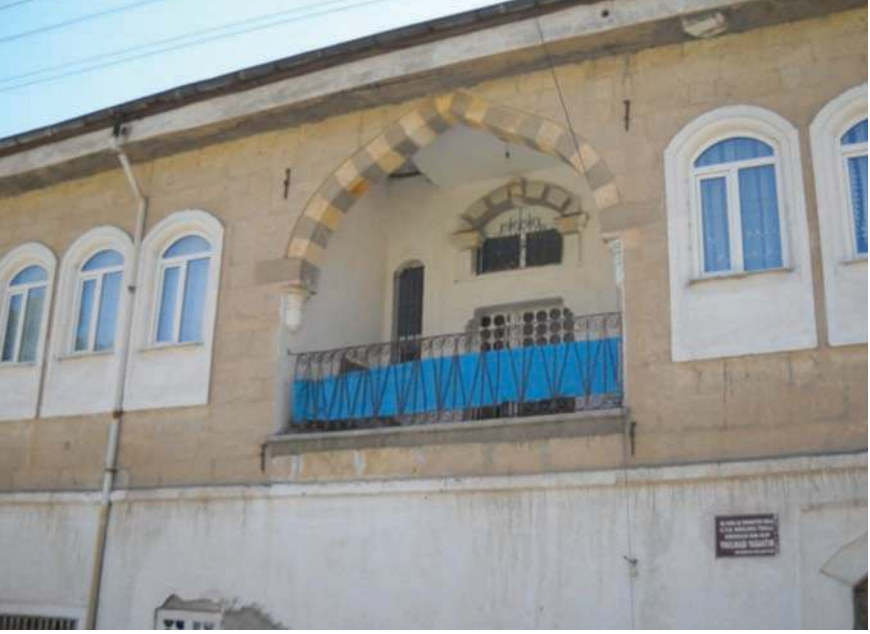
Fotoğraf 21- Dere Mah. Hafız İncekara Caddesi'ndeki 65 numaraya kayıtlı konut