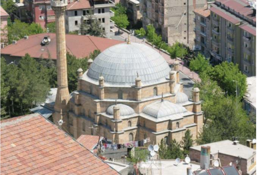
Fotoğraf 9- Damat İbrahim Paşa (Kurşunlu) Camii. Güneybatıdan genel görünüş

Şehrin güneybatısında bulunan ve Cami-i Cedit Mahallesi'ndeki, cami, medrese, sıbyan mektebi, imaret, kervansaray, hamam ve iki çeşmeden oluşan Damat İbrahim Paşa Külliyesi , Nevşehir'in en ünlü yapılar topluluğudur. Klasik Osmanlı mimarisinin son örneklerinden birisi olan külliyenin, topoğrafyaya başarılı bir şekilde uygulandığını görüyoruz. Kentin simgesi haline gelen külliye hakkında epeyce bilgiye rastlamak mümkündür (Anadol 1970; Kuran 1971: 243-247; Aktuğ 1992; Aktuğ Kolay 1993: 447-449; Mülayim 1996: 127-131).