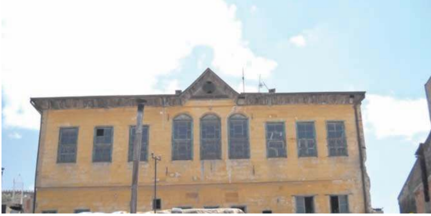
Fotoğraf 23- Kapucubaşı Mahallesi , Atabey Sokak 'taki Atabey Konağı

Kale'nin 350 m kuzeybatısındaki Atabey Konağı , Kapucubaşı Mahallesi Atabey Sokak 'a kayıtlıdır. Doğu-batı doğrultulu ve iki katlı anıtsal konağın ön cephesinde dokuz pencereye yer verilmiştir. Ahşap çatı, ortada üçgen bir alınlık oluşturacak şekilde inşa edilmiştir (foto 23). Konak bugün kullanılmamaktadır ve kısmen harapdır.