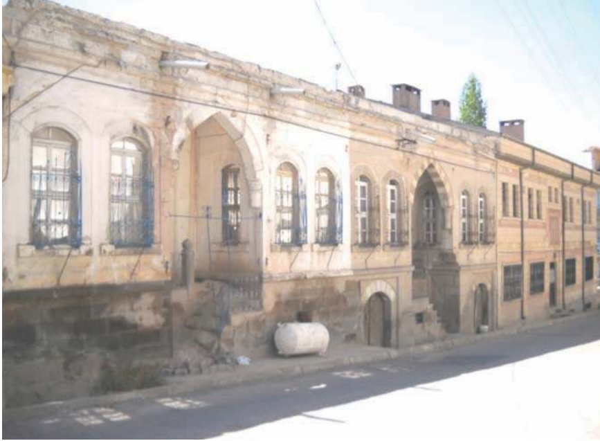
Fotoğraf 20- Dere Mahallesi Hafız İncekara Caddesi'ndeki 55 ve 57 numaralara kayıtlı konutlar

edilerek koruma altına alınmıştır. XIX. yüzyıl sonu-XX. yüzyıl başlarına ait bu maddi kültür varlıklarının sayısı 40 civarındadır. Dere Mahallesi Hafız İncekara Caddesi'ndeki dört konuttan birbirine bitişik olarak inşa edilmiş 55 ve 57 kapı numarasına kayıtlı taşınmazların cephelerinde ortak özellikler dikkati çekmektedir (foto 20): Simetrik yerleştirilmiş iki pencere arasına gemi teknesi sivri kemerli birer eyvan yerleştirilmiştir. Pencereleer erken Cumhuriyet yapılarında olduğu gibi büyük boyutludur. Eyvanın sokağa bakan cephesindeki merdivenlerle yüksek koddaki girişe ulaşılır. Cepheye hareket kazandıran silmeler ihmal edilmemiştir. Avrupa sanatının mimariye yansımalarını kabul etmeyen eden bu eserlerde, Osmanlı'nın klasik dönemine geri dönüş anlamındaki Neo Klasik üslup, bu dönem yapılarında da kendini bulmuştur. Taşın kolay elde edilmesi ve bolca bulunması nedeniyle, Nevşehir'deki taşınmazların neredeyse tümü bu malzemedendir (özellikle Nevşehir taşı olarak bilinen sarı taş).