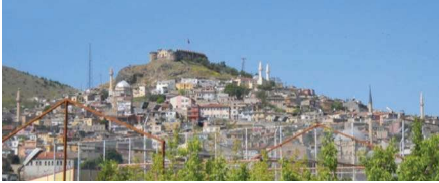
Fotoğraf 2- Nevşehir Kalesi ve çevresinin kuzeydoğudan genel görünüşü

Nitekim, batı girişinin yuvarlak kemeri, Selçuklu dönemine ait olmayacağını göstermektedir. 1.50 m açıklığa sahip doğu girişi ise dikdörtgen şekillidir ve üst kesimindeki kazıma kartuşun içi yazısızdır. Girişlerin bulunduğu cephelerde, her iki uçta da daire planlı birer burç yer alır. Maalesef kalenin iç kesimine, birbirinden bağımsız iki betonarme oturma platformu yapılarak, inşai ve fiziki müdahalede bulunulmuştur.