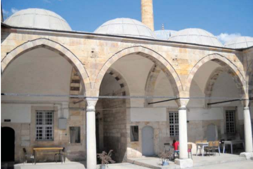
Fotoğraf 10- Damat İbrahim Paşa Medresesi. Giriş eyvanına avludan bakış

Caminin yer aldığı avlu kütesinin batısında, güneye doğru daralan bir parselde medrese, imaret ve sıbyan mektebi; bu grubun kuzeyinde ve onlardan bağımsız hamam uzanmaktadır. Kitabelerine göre, ilk üç yapı, İbrahim Paşa tarafından 1139/1726-1727 yılında, hamam ise 1140/1727-1728'de yaptırılmıştır.