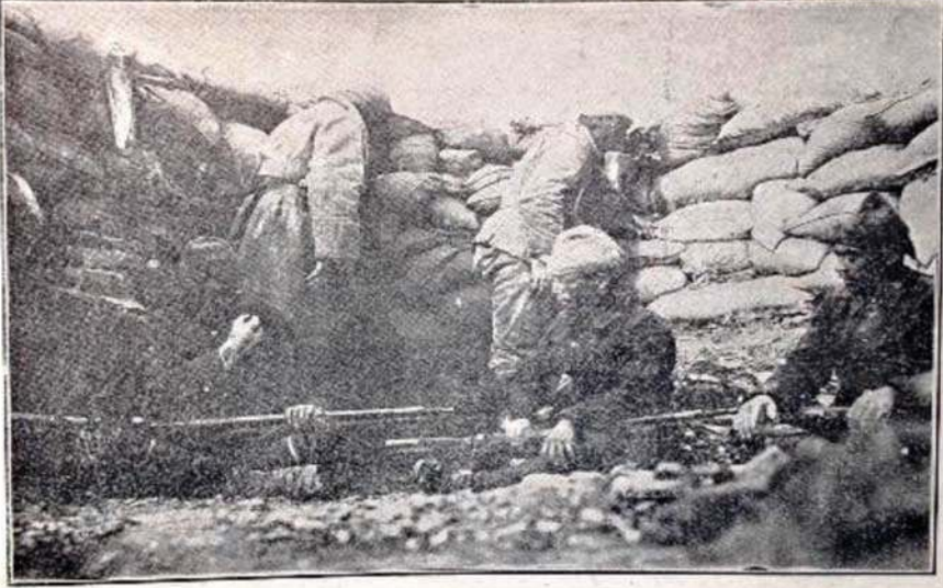
سپر حیات : آردازانلاری دشمنی گوزلرکن بریده جندکده عضا بیری

Ek-4: "Siper Hayatı: Arkadaşları Düşmanı Gözlerken Beride Cenk Musahebesi...", Harp Mecmuası , Hazırlayanlar: Ali Fuat Bilkan-Ömer Çakır, İstanbul 2004, s.265