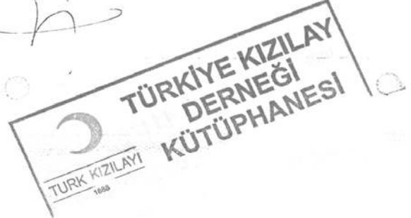
Belge-12 "Priştina'da İslam mekteplerinin dört senden beri kapalı olduğu ve ilkokul- larda okutulan kitaplar bulunmadığı için gerekli olan kitapların gönderilmesi hakkın- da", (15 Kasım 1916), TKDA, Kutu No. / Belge No., 350 / 3, (2 Teşrin-i Sani 1332).