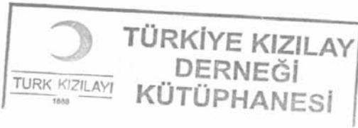
Belge-13 "Priştina'da İslam mekteplerinin dört senden beri kapalı olduğu ve ilkokullarda okutulan kitaplar bulunmadığı için gerekli olan kitapların gönderilmesi hakkında", (15 Kasım 1916), TKDA, Kutu No. / Belge No., 350 / 3, (2 Teşrin-i Sani 1332).