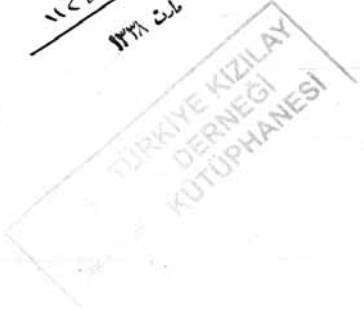
Belge-16 "Hilal-i Ahmer'in hastalık ve sağlık sorunları hakkında yazı ve kitap azlığı nedeniyle almış olduğu tedbirlere adı geçen sancağın yardımcı olabileceğinin sancağın elindeki kitapların listesiyle birlikte bildirildiği belge", (28 Şubat 1922), TKDA, Kutu No. / Belge No., 39 / 42, (28 Şubat 1338).