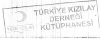
Belge-14 "Telif ve Tercüme Dairesi tarafından neşrolunan kitaplar ile Darülfunun me-mualarından yeterli sayıda bedelsiz tesliminin mümkün olmadığına dair", (8 Ağustos 1917), TKDA, Kutu No. / Belge No. 195 / 24, (8 Ağustos 1333).