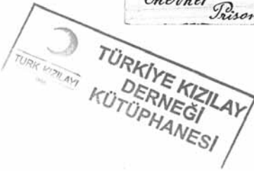
Belge-2 "Malta'da esir Şevket'in hukukla ilgili kitap gönderilmesi talebini içeren kartpostal", (14 Ağustos 1916), TKDA, Kutu No. / Belge No., 677 / 63, (1 Ağustos 1332)