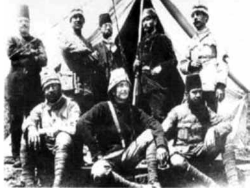
Kızılay ekibi, Derne'de birliklerin kumandanı Binbaşı Mustafa Kemal Bey ile birlikte (1912)

OHAC'ın 1911-1912 yılları arası süren Trablusgarp Savaşı esnasında bölgede önemli faaliyetler üstlenmiş olduğu bilinmektedir. Hatta derneğin çeşitli kaynaklarda özellikle Derne bölgesinde, başta Mustafa Kemal Paşa da olmak üzere, kuvvet komutanlarıyla iletişim ve koordinasyon içerisinde oldukları vurgulanmaktadır. OHAC savaş bölgesindeki çalışmalarını sürdürürken Anadolu'da da sosyal yardımlarına devam etmektedir.