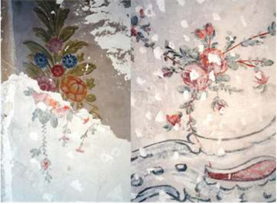
Foto.11: Pandantif kenarlarında yer alan bitkisel süslemeler Foto.12: Pandantiflerdeki gül demetleri

Camiye girişte kuzey yöndeki pandantifin alt sırasında müezzın atama kitabesi bulunmaktadır (Foto.13). Bu kitabenin Latin harflerle okunuşu şu şekildedir: