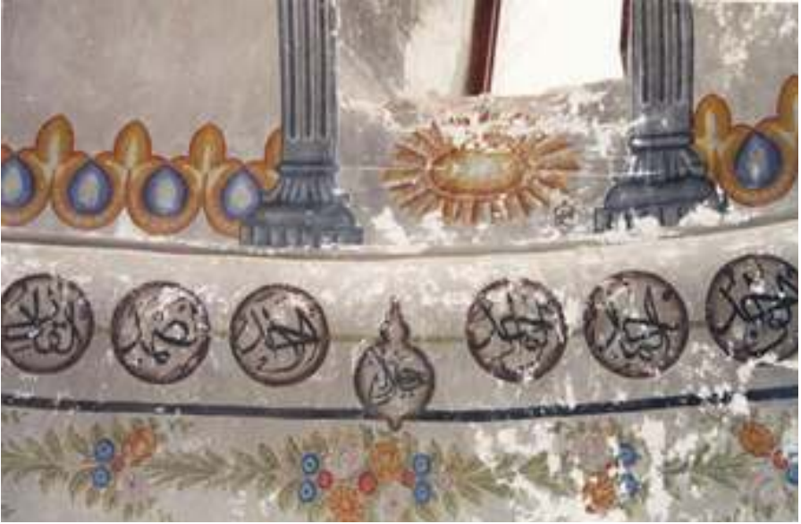
Foto.6: Mimari tasvirli süslemeler ve Esmâ-ül Hüsna yazılarından detay

Kubbe kasnağında toplamda 8 adet pencere yer alır. Bu pencerelerin çevresi mavi renkli iri akantus başlıklı sütunlar ile çevrenmiştir (Foto.5-6). Kasnakta yine yer yer silik olmakla birlikte lacivert ve kırmızı renklerde Allah'ın isimleri yer almaktadır. Alt sırada, hemen pencere bitiminde sıralı bir şekilde hardal renginde palmet motifleri vardır. Pencerelerin hemen altında da yine hardal renk ile uygulanmış güneşe benzer elips şeklinde madalyon motifi ile burada hareketlilik sağlanmıştır (Foto.6). Buranın hemen alt eteğinde kemerlerin üst hizasında madalyonlar içinde Esmâ-ül Hüsna yazıları bu kısım dolaşır. Madalyonlar, kemer kilit taşının hemen hizasından siyah bir kontür çizgisi ile ayrılmıştır (Foto.6).