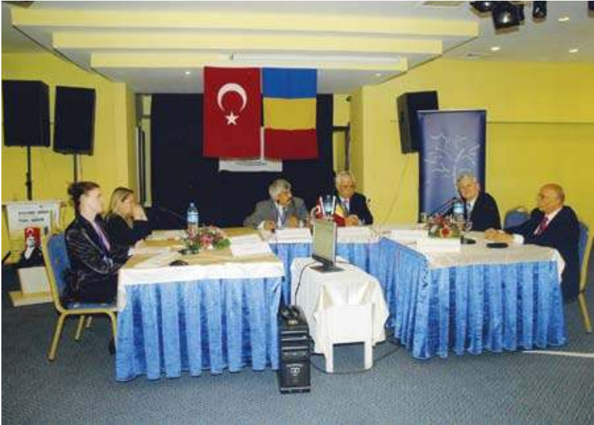
Türk-Romen Kültür İlişkileri Çalıştayı'ndan iki görünüm.