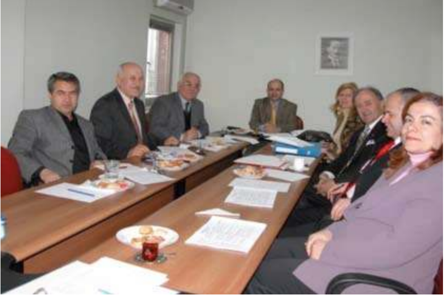
21. Yüzyılı Nasrettin Hoca İle Anlamak Uluslararası Sempozyum (8-9 Mayıs 2008 / Akşehir) Düzenleme Kurulu çalışmalarından bir görüntü.