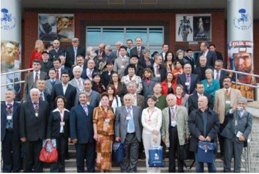
21. Yüzyılı Nasrettin Hoca İle Anlamak Uluslararası Sempozyum (8-9 Mayıs 2008 / Akşehir) katılımcılardan bir grup.