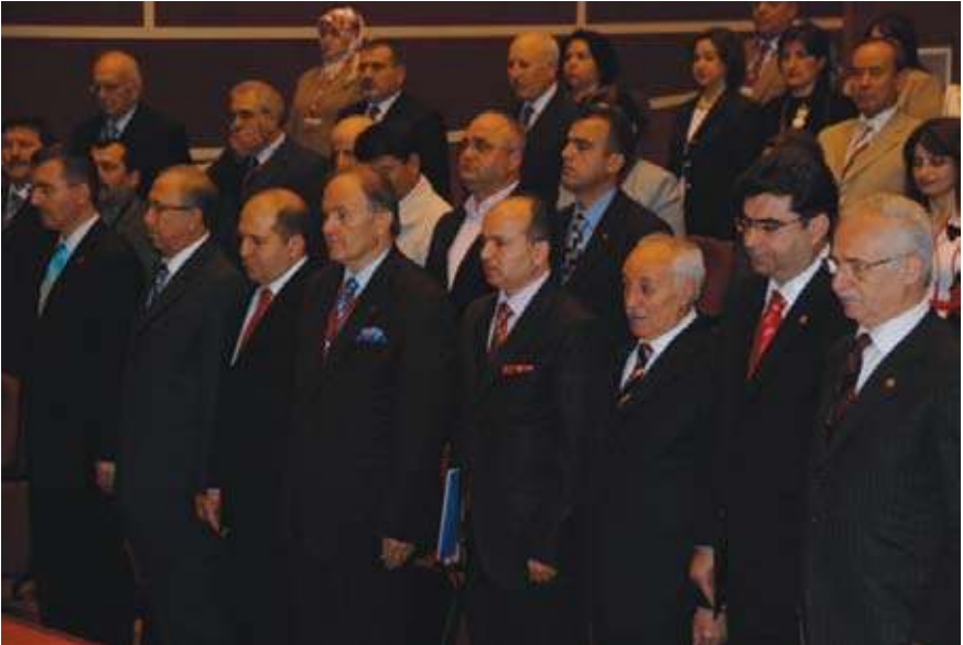
21. Yüzyılı Nasrettin Hoca İle Anlamak Uluslararası Sempozyum'un (8-9 Mayıs 2008 / Akşehir) Açılış Töreni.