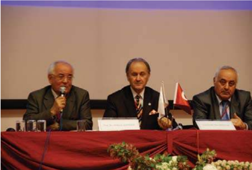
21. Yüzyılı Nasrettin Hoca İle Anlamak Uluslararası Sempozyum'un Kapanış ve Değerlendirme Konuşmaları (8-9 Mayıs 2008 / Akşehir).