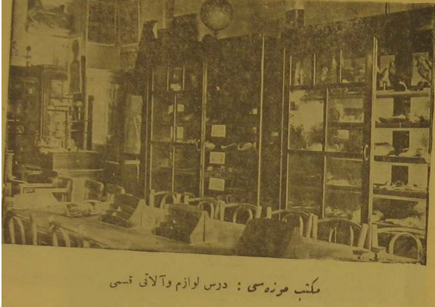
Ek.3: Mektep Müzesi'nde sergilenen eşyaların listesi. (Maarif Vekâleti Mektep Müzesi Rehberi, İstanbul 1928).