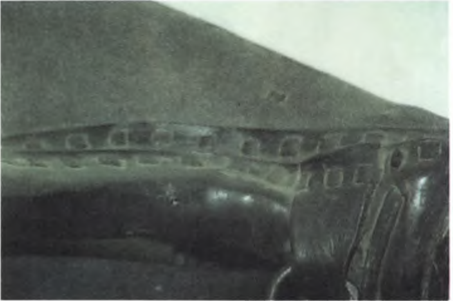
Fotođraf 11 : Su kırbası (a) Envanter no: 2702, Türk , 20. yüzyıl ve su kırbasının detayı (b)