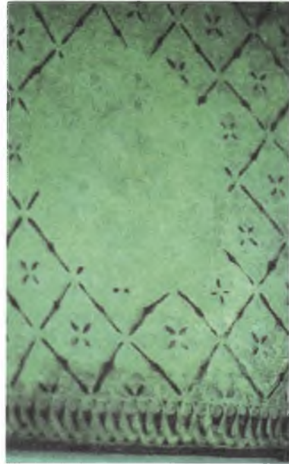
Fotoğraf 2: Sadak (a) Envanter no: 25707, Türk , 18. yüzyıl ve sadakın detayı (b)

3.3. Tozluk : Kırmızı meşinden yapılan tozluk, müzenin deposundadır. Tozluğun boyu 32cm. ve eni, 17cm. dir. Tozluğun üst kenarı bordür biçiminde ve sim-sırma ile işlenmiş kıvrık dallar ve dilimli yapraklardan oluşan bitkisel motiflerle bezenmiştir. Ayrıca tozluğun baldır bölümünde, yanlarda yukarıdan aşağıya doğru giderek kısalan yedi yatay çizgi ve bunları dik olarak ortadan kesen uzun çizginin oluşturduğu motif te yine sırma ile işlenmiştir. Tozluk yedi adet kopça ile birleşmektedir (Fotoğraf 3).