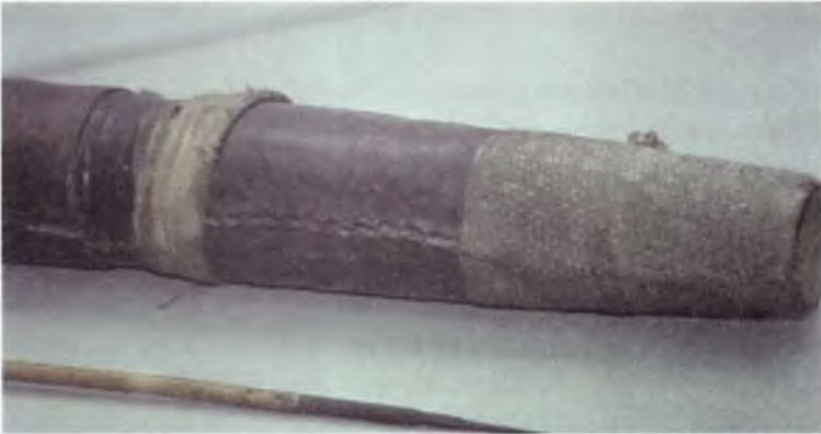
Fotođraf 1 : Tirkeř (a) Envanter no: 469, Tñrk , 17. yñzyıl ve tirkeřin detayı (b)