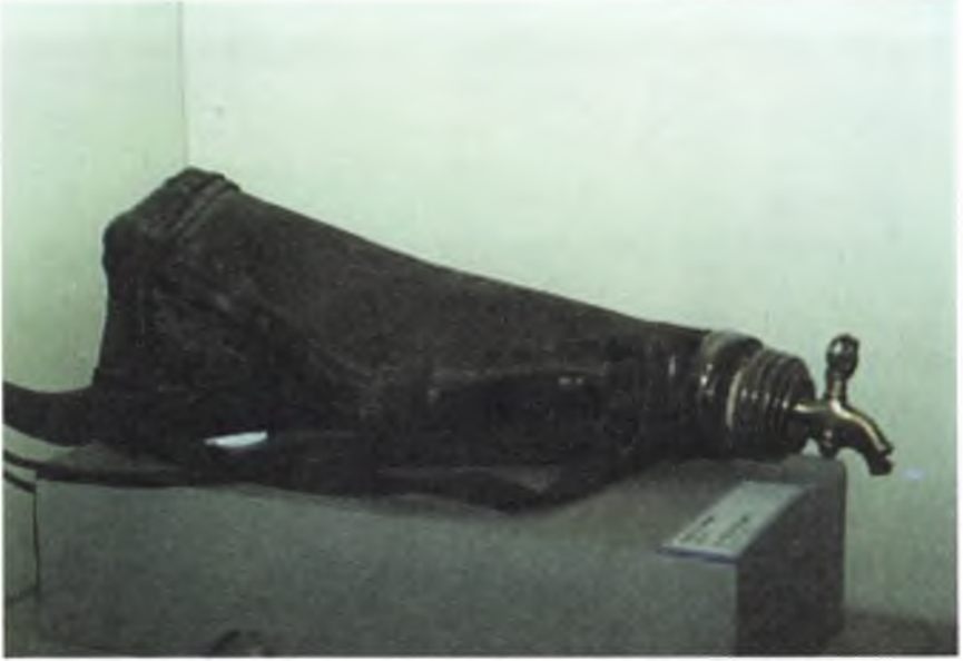
Fotođraf 10 : Kamçı (a) Envanter no: 7853, Türk (Çerkez), 20 yüzyıl ve kamçının detayı (b)