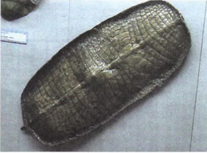
Fotoğraf 4 : Timsah derisi kalkan, Envanter no: 202-45, Hint, 18. yüzyıl