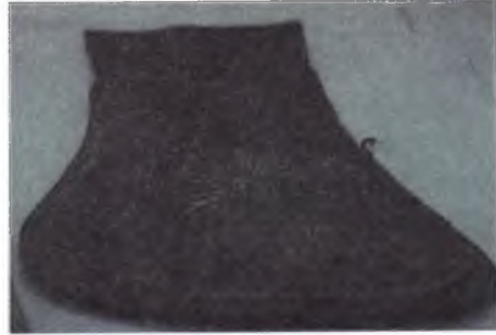
Fotoğraf 7 : Eyer takımı (a) Envanter no: 21224, Türk (Yeniçeri), 19. yüzyıl başı ve eyer takımı detayları ( b ve c).