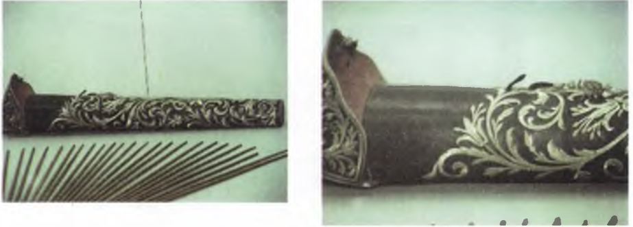
Fotoğraf 8 : Tirkeş (a) Envanter no: 25708, Türk, 19. yüzyıl ve tirkeşin detayı (b)

3.8. Tirkeş (Kubur) : Tirkeş, atıcı silahlar salonunda sergilenmektedir. Tirkeşin boyu 72cm., eni 38cm. ve ağırlığı 0,980 kg. dır. Siyah meşin kaplama olan ok mahfazasının ön yüzü ve kapağı sırma işlemelidir. İşleme bitkisel motiflerden oluşmaktadır. Kıvrık dallar ve bu dallardan çıkan hançer yapraklarla lale motifleri simetrik olarak düzenlenmiştir. Arka bölümden,kapağı ortalayarak çıkan taşıma kayışının üzeri de “S” kıvrımlar çizen bordür motifi ile bezenmiştir. Mahfazanın arka yüzünden çıkarak öne dönen kapak, ön ortada sırma püsküllü şerit ile tutturulmaktadır (Fotoğraf 8 a, b).