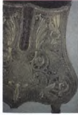
Fotoğraf 9: Kuburluk (a) Envanter no: 1934, Osmanlı , 19. yüzyıl ve kuburluğun detayı (b)

3.10. Kamçı : Koyu kahverengi deriden yapılmış kamçı, binicilik salonunda sergilenmektedir. Sap uzunluğu 53cm.dir. Kamçının sap kısmı ahşap üzerine meşin kaplıdır. Helezonik bükümler biçimindeki ahşap zeminin üzeri, meşin ile kaplanıp, girintili bölümleri tel ile sarılarak belirginleştirilmiştir. Deri şeritlerle yuvarlak biçimde örülmüş kamçı, yer yer düğümlü bir çift kösele sırimla sonlanmaktadır. Kamçının, sapı ile birleştiği bölümde deri püskül yer almaktadır (Fotoğraf 10 a,b).