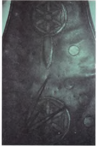
Fotoğraf 6 : Ok hedefi (a) Envanter no: 21038, Türk , 18 ve 19. yüzyıl ve ok hedefinin detayı (b)