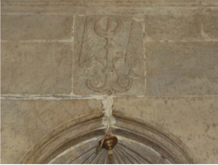
Fotoğraf 13. Hırka Köyü Camisi, mihrap kemerinin üzerindeki nesneli bezeme