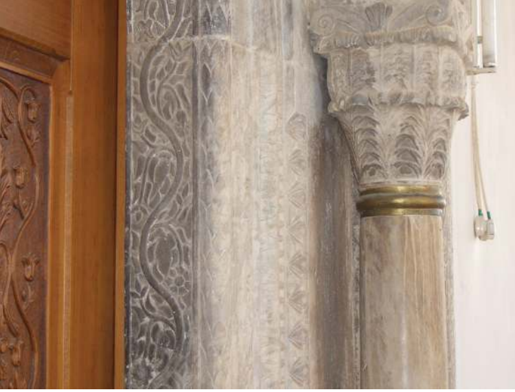
Fotoğraf 6. Hırka Köyü Camisi, eksenin doğusundaki taçkapı şeridi