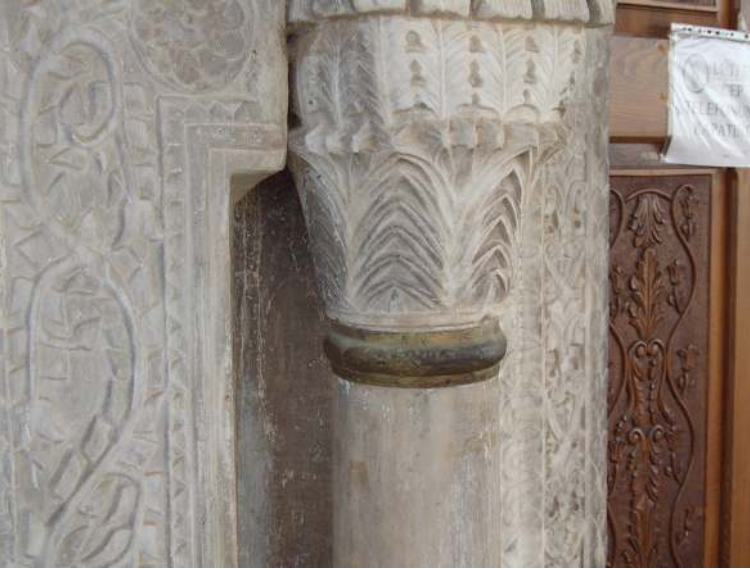
Fotoğraf 7. Hırka Köyü Camisi, eksenin batısındaki taçkapı şeridi