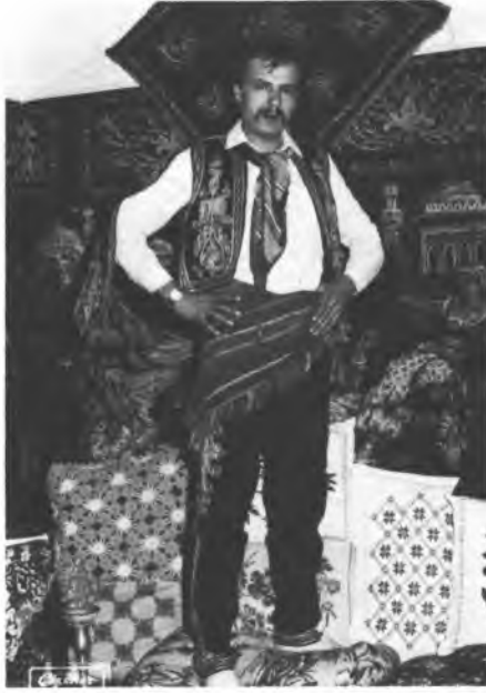
5 - Çankırın'da Geleneksel Giyimli Bir Yâren