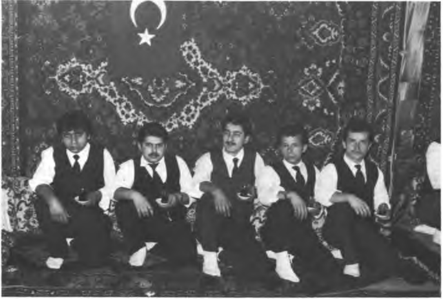
3 - Yärenler Oturuş Düzenine Göre Çay İçerken