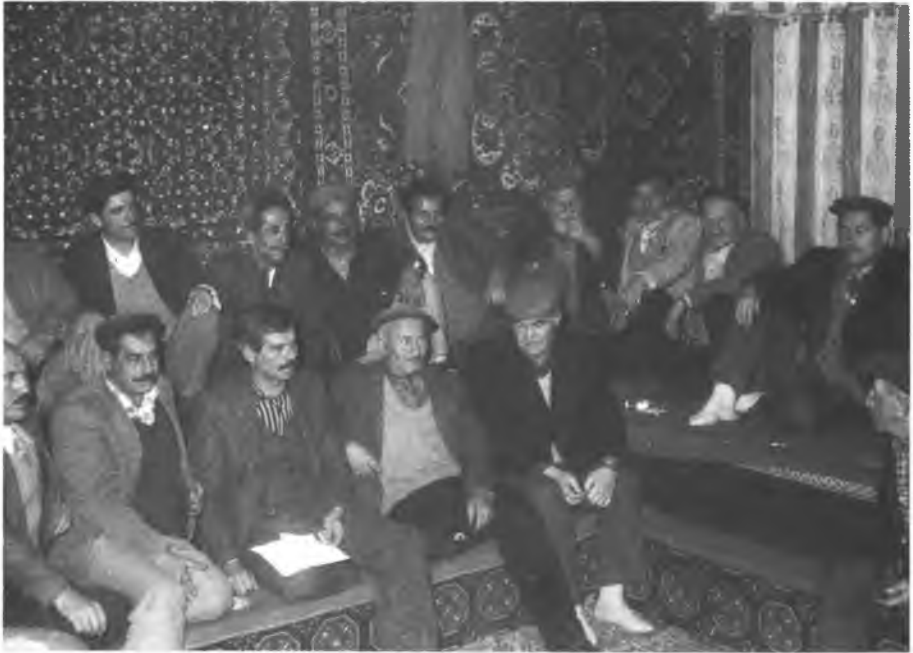
4 - Eldivan'da Köy Odasında Sohbetten Bir Görüntü