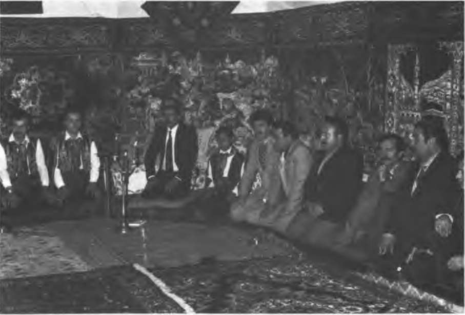
2 - Yâren Odasında Başağa ve Yârenler