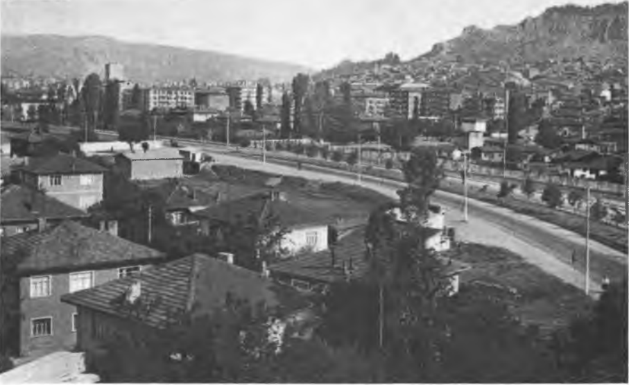
1 - Çankiri'nin Genel Görünümü