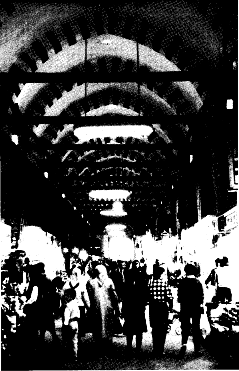
Resim 3 — Edirne Semiz Ali Paşa Çarşısı'nın iç görünüşü.