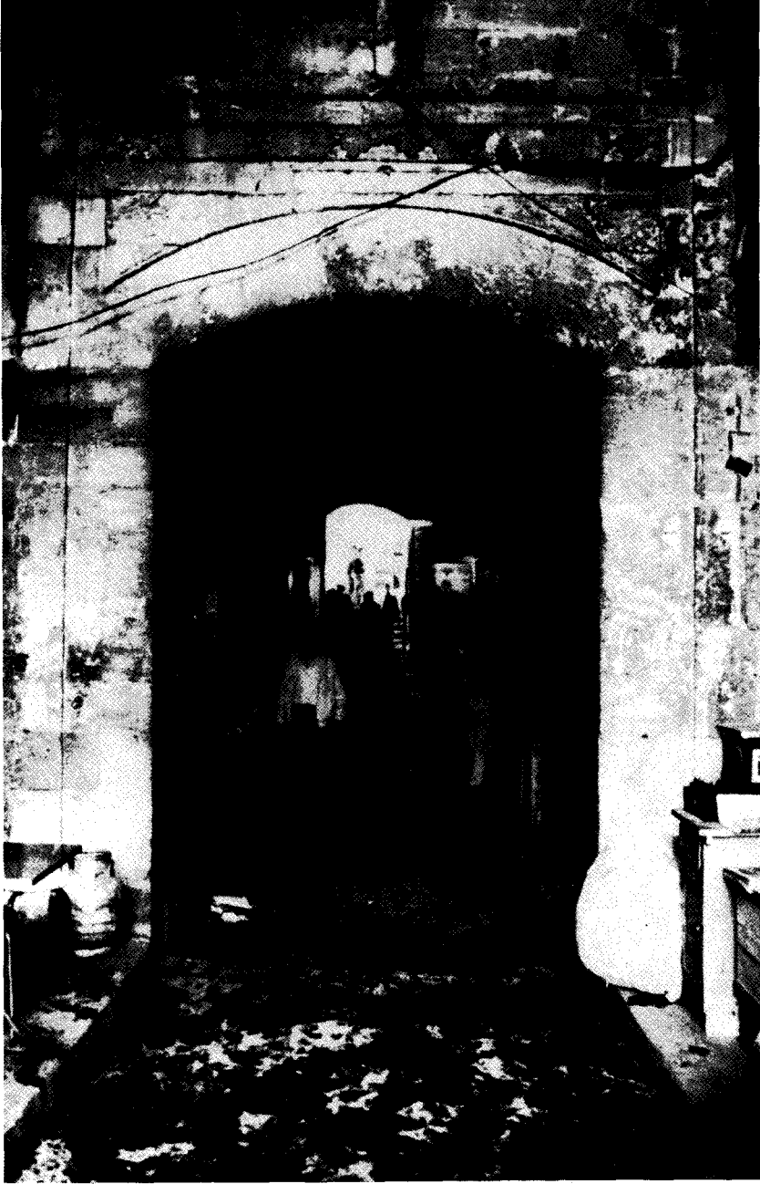
Resim 1 — Edirne Semiz Ali Paşa Çarşısı'nın sur kapısı.