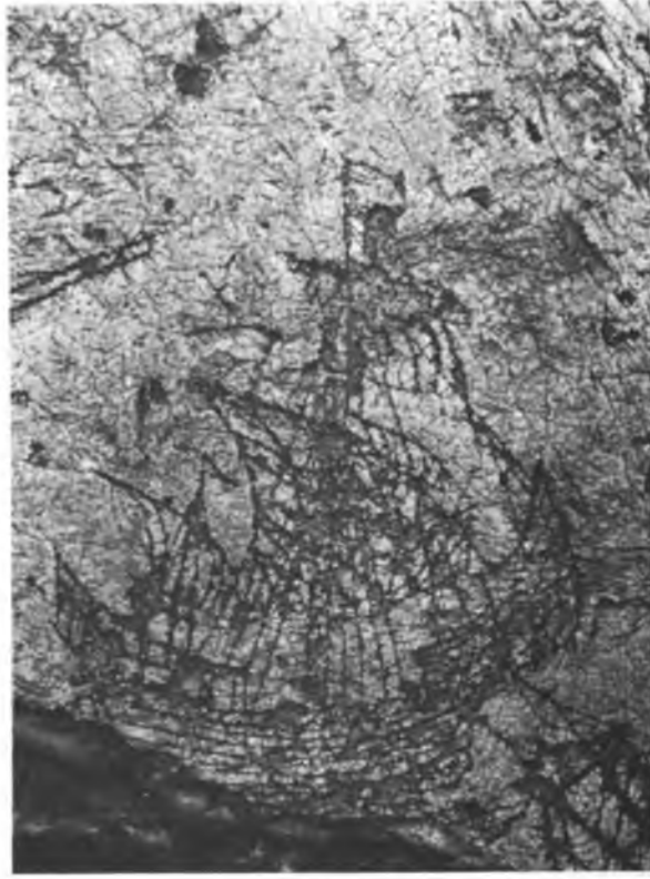
Res. 6 — Doğu duvardaki büyük karracke (No. 5). Abb. 6 — Karracke (Nr. 5) Ostmauer, Narthex.