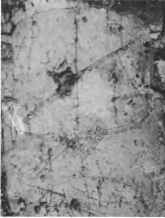
Res. 1 — Kuzey duvardaki selander tasviri.

Abb. 1 — Selander Nordmauer, Narthex.