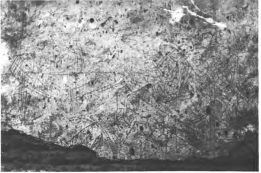
Res. 3 — Doğu duvardaki büyük graffiti.