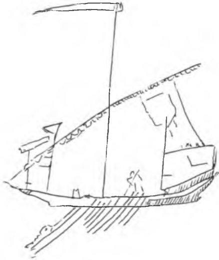
Res. 2 — Kuzey duvardaki selander tasvirinin çizimi.

Abb. 1 — Selander Nordmauer, Narthex.