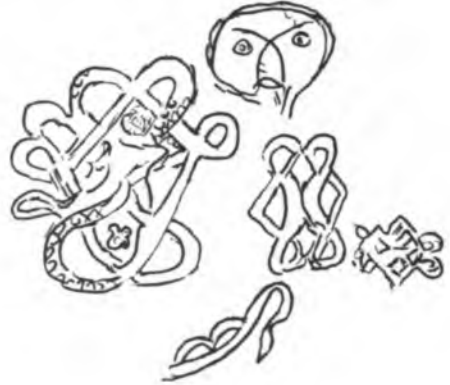
Res. 7 — Doğu duvardaki deniz canavarının çizimi. Abb. 7 — Seeungeheuer, Ostmauer, Narthex.

Bu metnin fotoğraflarını çeken P. Knut Autzen'e ve P. Horst Koob'a teşekkür etmeyi bir borç biliyorum.