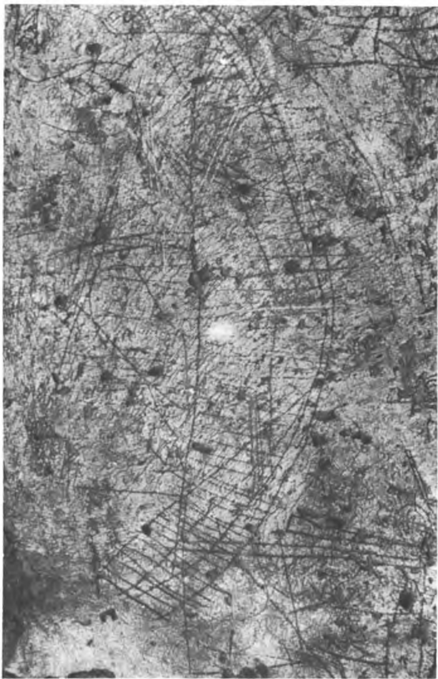
Res. 5 — Dođu duvardaki bir direkli kadirga (No. 1).